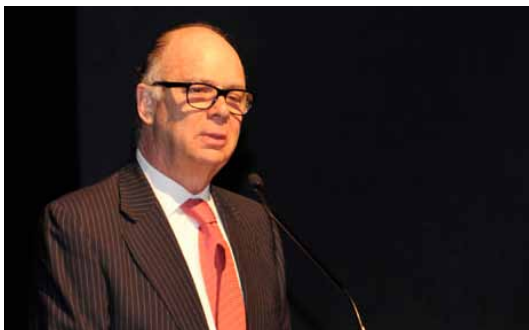
Enrique Krauze.

No lo he logrado por supuesto, pero Cosío Villegas representaba la mejor tradición que venía de Vasconcelos. Él logró bajar a la tierra el proyecto idealista cultural latinoamericano de Vasconcelos, en vez de dejarlo en ideas y proyectos fantasiosos y libros extraordinarios y un poco enloquecidos como La Raza Cósmica . Lo que éste hombre práctico hizo, fue bajar La Raza Cósmica a la realidad y convertirla en el Fondo de Cultura Económica. Porque el Fondo de Cultura Económica fue –lo sigue siendo en una