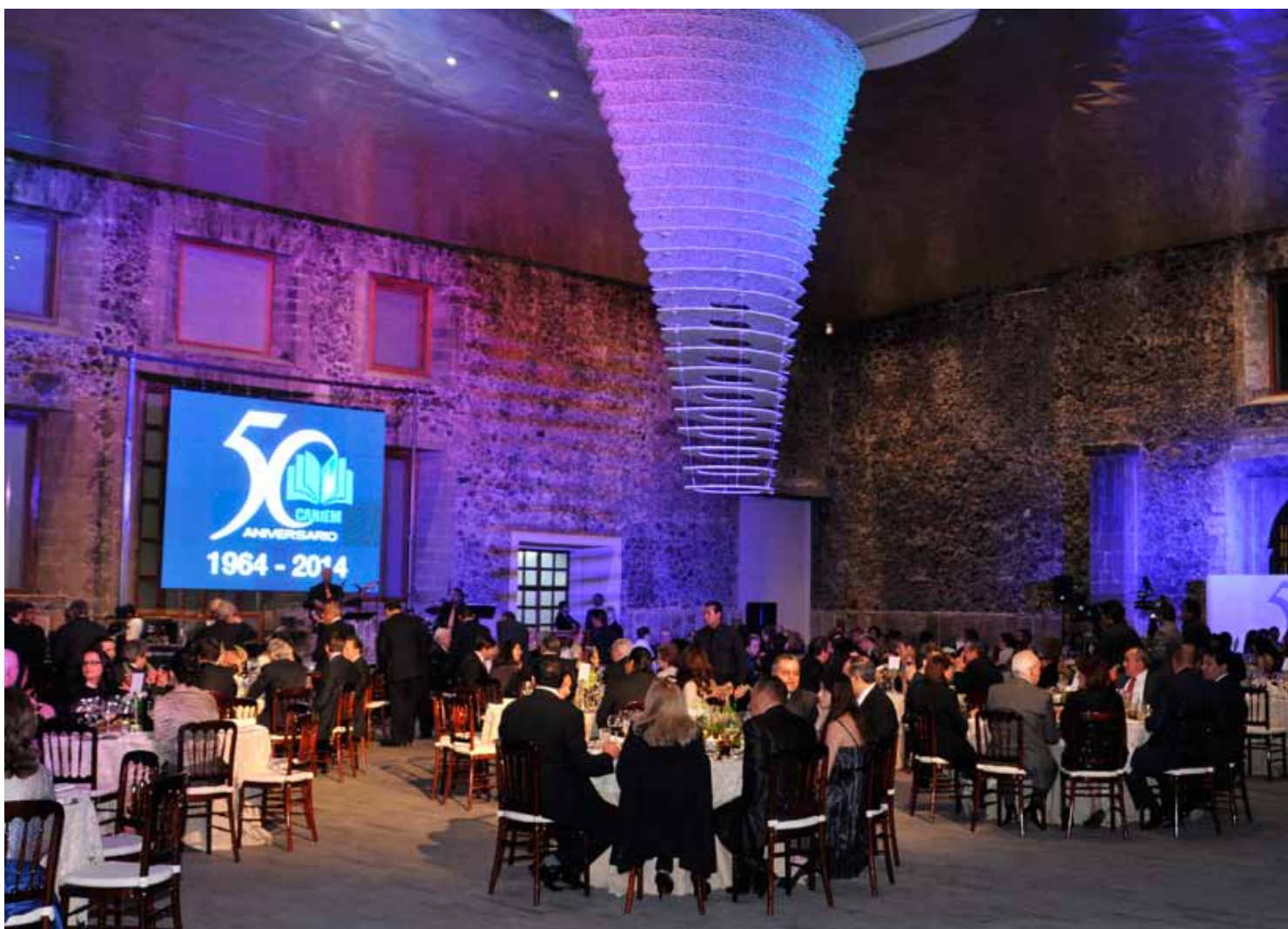
Patio central de la Biblioteca de México.

Durante el acto que inauguró las celebraciones de la CANIEM, también fue cancelada una estampilla postal dedicada a su 50 aniversario. El programa de actividades continuará el 4 de marzo con la celebración del sorteo de la Lotería Nacional alusivo al organismo y el 25 de marzo con la realización del Foro Internacional: "Contenidos digitales: El reto educativo" en el Museo Nacional de Antropología. Del 25 de abril al 5 de mayo, en el mismo marco se celebrará la primera edición de Expo Publica, libros y revistas a la vista, una feria dedicada a los libros que se realizará en el World Trade Center.