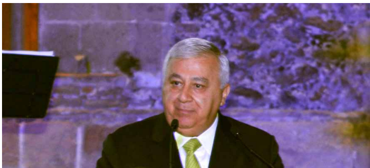
Emilio Chuayffet Chemor.

En esta valiosa industria –continúo el Secretario de Educación– tenemos un gran aliado para lograr que la Reforma emprendida por el presidente Enrique