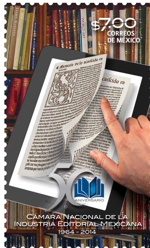
Timbre postal conmemorativo del 50 Aniversario de la CANIEM

La primera emisión de cancelación de la estampilla postal conmemorativa del 50 Aniversario de la CANIEM está ya en circulación y se puede adquirir en cualquier oficina de SEPOMEX en la República.